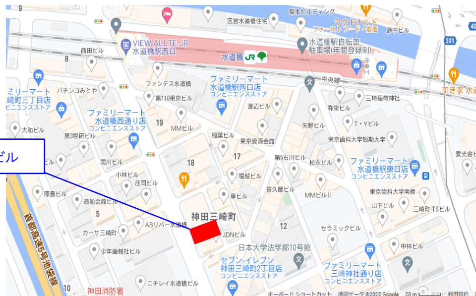
セントバンフビル

JR中央・総武線 「水道橋」駅 徒歩2分 都営三田線 「水道橋」駅 徒歩6分 東京メトロ 半蔵門線 「神保町」駅 徒歩7分