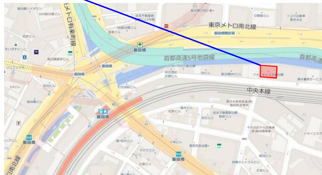
飯田橋 i-MARK ANNEX

開館時間 平日・土・日・祝日 7:00～20:30 ※カードキーにて24時間出入り可 警備方法 機械警備方式 空調方式 個別空調方式 天井高 3～7F 2,500mm 8～10F 2,400mm OA床高 35mm 床荷重 約300kg/m 2 電気容量 60VA/m 2 光ケーブル 引き込み可 ELV 乗用2基