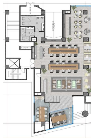
セットアップオフィス (案)