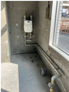
給排水・ガス設備