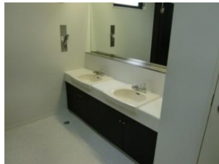
トイレ・カウンター