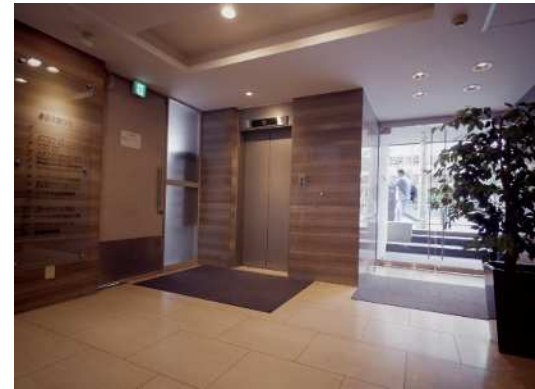
【エントランスホール①】