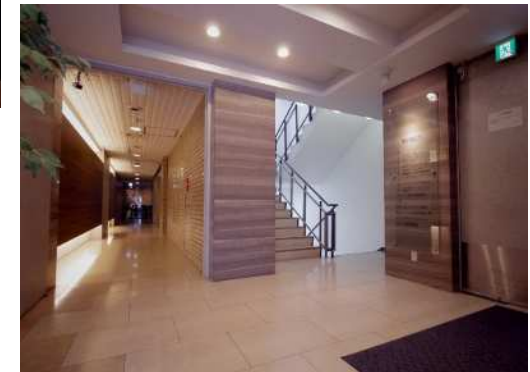
【エントランスホール②】