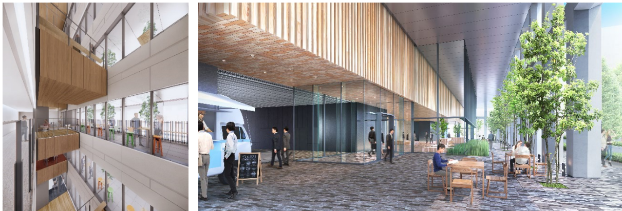
基準階共用部、1階ピロティ（イメージパース）

また、豊かな緑に囲まれた開放的なピロティには、キッチンカーの導入を予定しており、地域の賑わい創出にも貢献します。