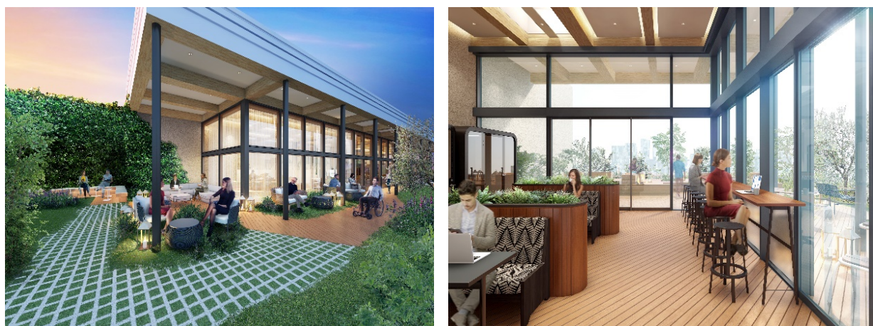
最上階ラウンジ、テラス（イメージパース）

また、創エネルギーの一環として、最先端のテクノロジーを取り入れたハンガリーのスタートアップ企業「Platio社」のソーラー舗装パネルを屋上テラスの一部に導入することを検討しています。