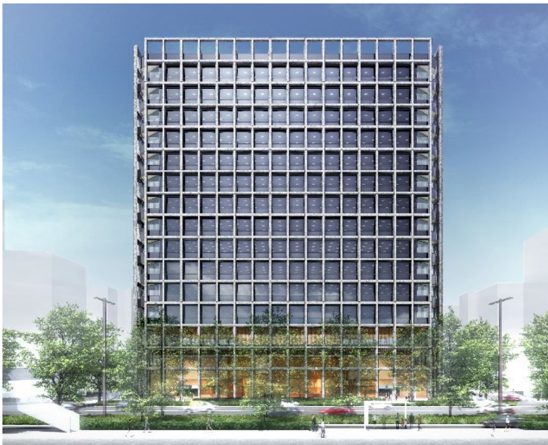
外観正面 (イメージパース)

本計画は、旧名古屋フコク生命ビル跡地と清水建設グループ所有地で構成する約4,820㎡の敷地に、延床面積約47,500㎡、16階建てマルチテナント型オフィスビルを開発するものです。2021年10月に着工し、現在、12階躯体工事、8階内装工事等を進めているところです。竣工は、富国生命の創業100周年度に当たる2024年3月を予定しています。